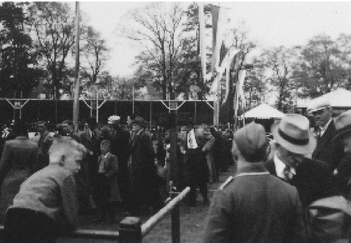
PC 1941: ûnder tasicht fan de Dútsers.

de swarte broek allegearre in wyt shirt drage (mei dêr in 'overgooier' oerhinne) moat de foto noch yn de earste omloop nommen wêze: yn de twadde omloop koenen de keatsers yn dy tiid har eigen kleur shirt útsykje. Dat der noch net oeren spile wêze sil, soe men ek opmeitsje kinne út it fjild: dat liket noch net bot ferrinnewearre. It fjild ferkeart oars, nettsjinsteande al it reinwetter, 'in een prachtconditie'. 15 De karmaster by de opslach hat gjin oerjas oan, dat it sil ûnderwilens wol droech wêze. Der lykje (ek op de oare foto's) noch wol aardich wat plakken frij op bank en tribune en de net-beteljende taskôgers op it Bolwurk litte har noch goed telle. As wy al dy gegevens kombinearje mei wat fierder oer de dei