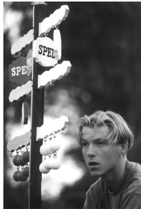
Sa te sjen hat dizze tillegrafist de kop der goed by.

It teltastel is yn 1855 útfûn troch Ane Buwalda Kuijpers, ien fan de fiif oprjochters fan de PC (1853). De regels fan it keatsen, dat doe hjirre oars foar't neist al 350 jier beoefene waard, leinen yn dy tiid noch net sa fêst. Dêrom liet de PC yn 1855 in Korte verklaring van het kaats-spel útkomme (dat tagelyk it earste keatsreglemint foar ús keatsen wie). Oan de ein fan it boekje fan acht siden skriuwt Buwalda Kuijpers: "Het was gemakkelijker voor den toeschouwer bij het Kaats[s]spel, dat een telegraaf gesteld werd bij de Kaatspartij; waarop een ieder dadelijk den stand van dit spel konde zien, deze zoude gemakkelijk door een oppasser in orde kunnen gehouden worden die ten allen tijde het spel nauwkeurig gadesloeg". En dan folget in koarte beskriuwing fan it tastel. Op de PC fan dat jiers wie de tillegraaf foar it earst yn gebrûk. It is lang net ûnmooglik dat Buwalda Kuijpers, dy't om 1855 hinne weinmakker wie, dy sels makke hat. Stadichjesoan hat it teltastel ek by oare ferienigingen en yn oare plakken syn nuttich wurk dwaan kinnen. In foardiel dat Buwalda Kuijpers net neamt, is dat in goed byhoden tillegraaf in ein makket oan (potinsjele) strideraasje tusken de spilers oer "hoe't it stiet". No hie yn it ferline net elke keatsferieniging it jild om tillegrafan oan te skaffen, dat oarloch om de stân, troch berekkene keatsers soms mei sin útlukke, wie net alhiel in seldsumheid. Eins moat ik sizze