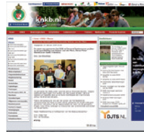
Homepage op de KNKB-website fan 1 jannewaris 2008.

Yn it foarjier fan 2007 is de KNKB úteinset mei in nije website. By de presintaasje waard de ambysje útsprutsen dat de site yn de takomst mear funksjonaliteiten ha moast. It gie ynearsten om in site mei ynformaasje en in goed rinnend opjeftesysteem. Yn in lettere faze soe der omtinken jûn wurde oan ynteraksje tusken keatsers en der soe romte komme foar ferskate 'communities'. Hoe is de stân fan saken no en wat is troch de nijste ICT-úntwikkelings mooglik?